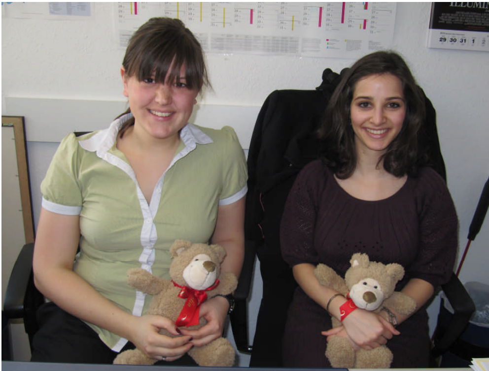
Abschied von unseren tollen Praktikantinnen mit Berliner Kuschelbär